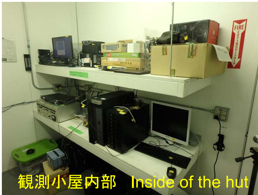
観測小屋内部 Inside of the hut