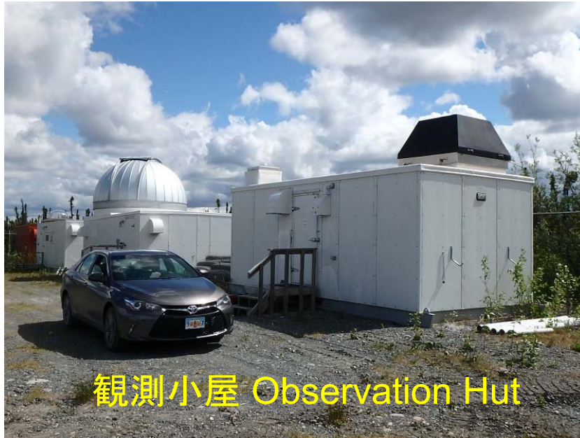
観測小屋 Observation Hut