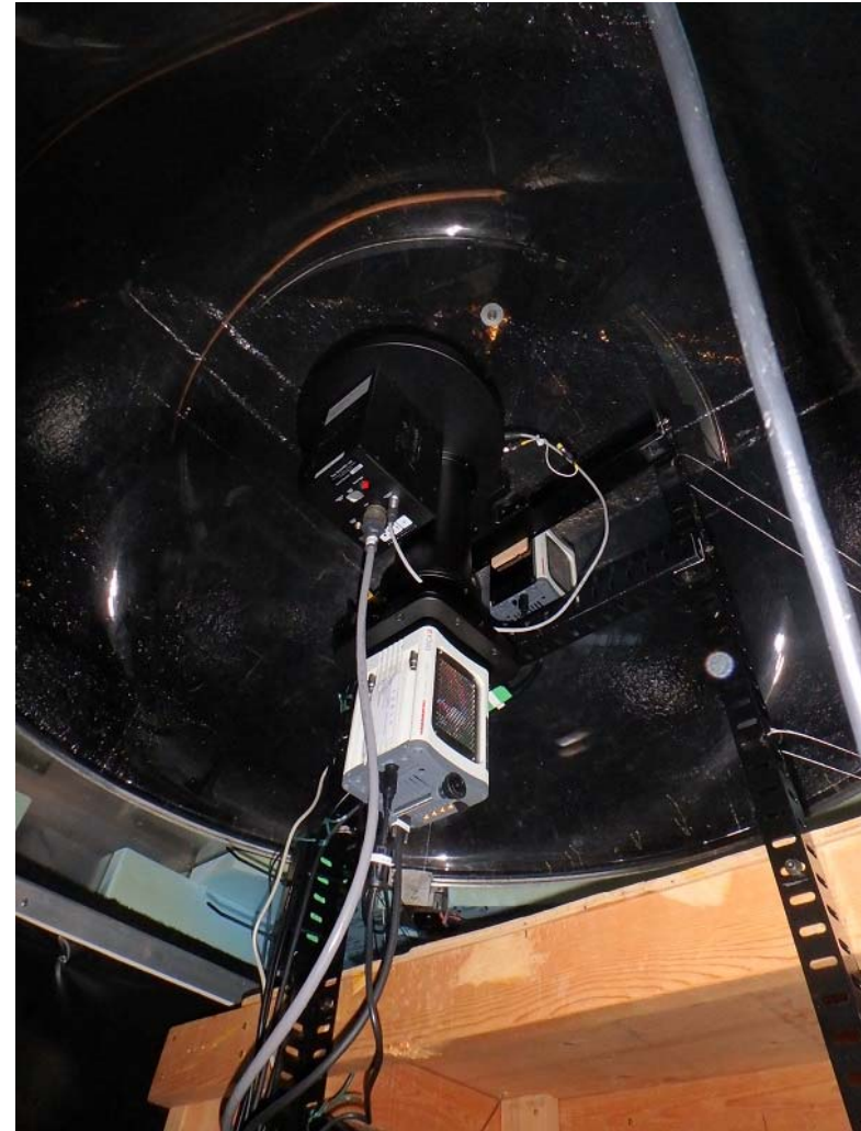
全天カメラ (OMTI & EMCCD) All-sky cameras (Not operated during summer)