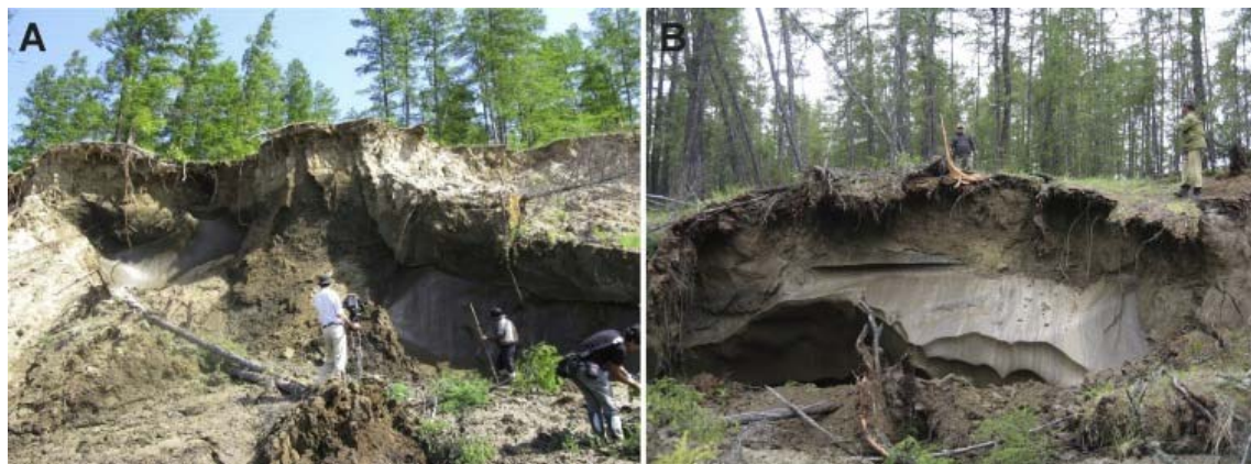
図 2 永久凍土の断面図。地下に氷楔とよばれる地下氷が存在していることがわかる。A の地下氷は幅 8m で深さ 40m、B の地下氷は幅 10m で深さ 60m。対象地域の年降水量は 240mm ほどでモンゴル・ウランバートルとほぼ同じである。少ない降水量にも関わらず森林が成立するのは、永久凍土が存在するためである。(論文では Fig.3)