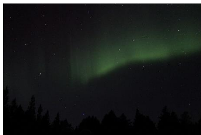
図1 3/13 22UT 頃に観測されたオーロラ

本訪問を通して得られた観測データをさらに解析して自身の投稿論文、修士論文研究に生かしていきたい。