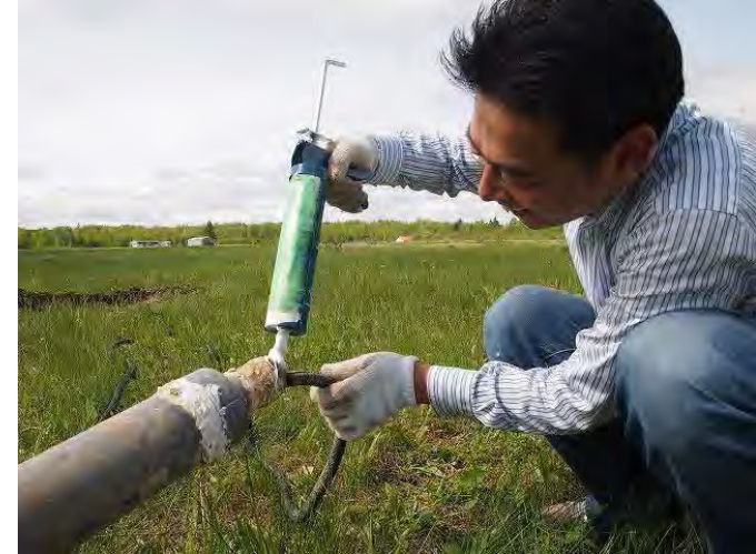
防水用シリコン再塗布中 Dr. Nose is applying silicon past on the joint of the sensor cover