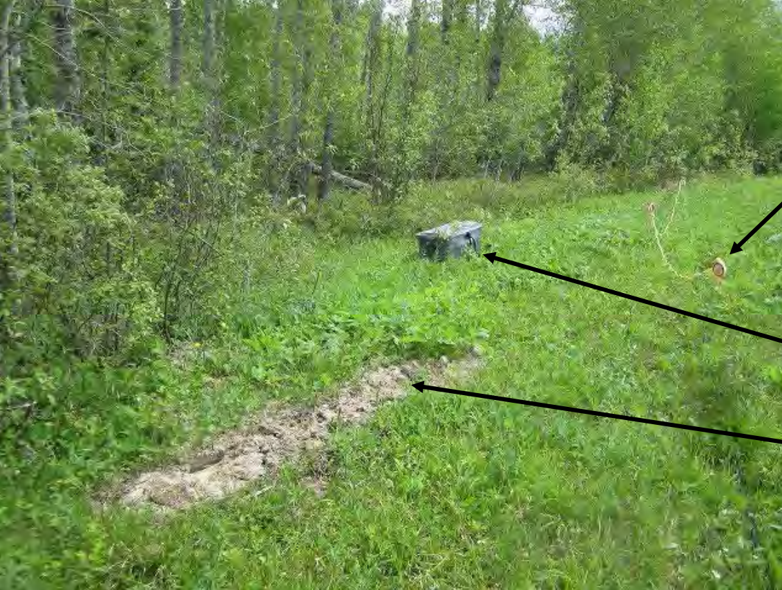
金属製のマーカー The metallic markers