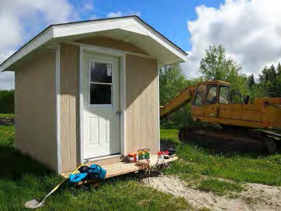
観測小屋 (正面) Observation Hut (front side)