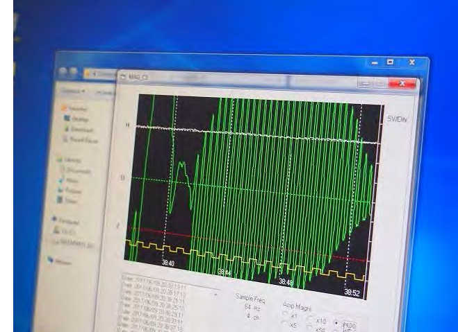
センサー付近で金属製マーカ ーを振った時の出力 Magnetometer output when a metallic marker was shaken near the sensor.