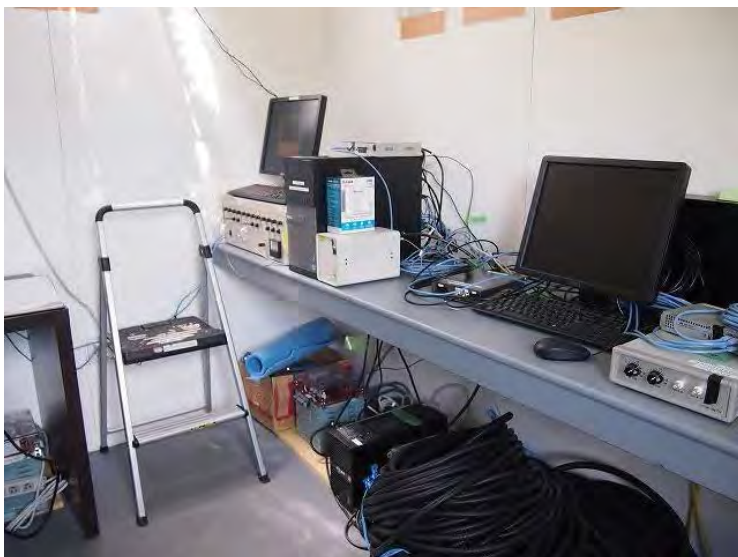
観測小屋内部 Inside of the hut