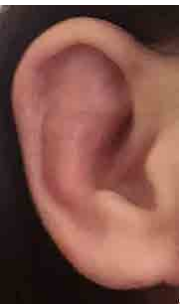
The menace of bugs....