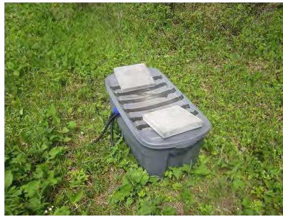
ケーブル収納ボックス The plastic box for the surplus cables