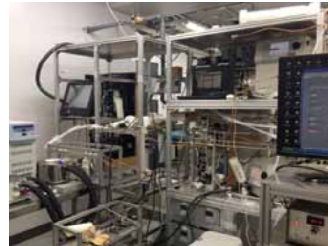
エアロゾル粒子の吸湿成長度と雲凝結核活性を測定するための装置群 (HTDMA, CCNC等)

私たちは、吸湿特性測定用タンデムDMA (HTDMA) や雲凝結核カウンタ (CCNC) と呼ばれる先端計測装置を用いて、大気エアロゾルが空気中の水分を取り込んで成長する程度を詳細に調べています。そして、これらの装置で得られるデータと、エアロゾルの化学組成の分析を組み合わせることにより、粒子中の化学成分が、水の取り込み/蒸発などの熱力学的な平衡条件に、どのような寄与があるのかを評価します。極めて複雑な組成を持つ有機物がエアロゾルの吸湿特性・雲凝結核活性に及ぼす影響についての理解は特に不足しており、有機物の化学構造と吸湿特性の関係など、有機物の寄与を定量的に把握するための研究に力を注いでいます。