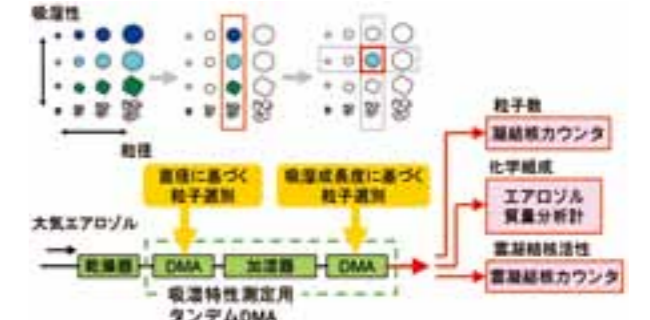
吸湿特性測定用タンデムDMAと他のエアロゾル計測器を組み合わせる、大気エアロゾルの混合状態の解析手法。

個々のエアロゾル粒子を区分する指標として、歴史的には「粒径」が最も一般的に扱われてきました。しかし、同サイズの粒子でも、発生源・生成変質過程の違いにより、様々な組成・特性を持つものが大気中に混在しています。私たちは、吸湿特性測定用タンデムDMA (HTDMA) を用いることで、粒径以外に吸湿成長度（加湿に伴う粒径の変化率）を基準に粒子を選別することが、異なる組成・特性を持つ粒子の混合状態を理解する上で有効であると考え、大気エアロゾルの化学組成や特性を、エアロゾルの混合状態（粒径+吸湿特性）とともに解析する研究を始めています。この取り組みにより、大気エアロゾルの特性や過程を、混合状態の視点も含めて把握する新しい研究の展開を図ります。