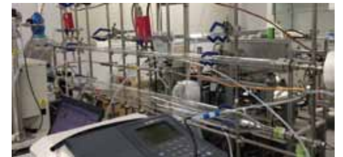
エアロゾル粒子をオゾンに曝露する反応実験のための装置

大気エアロゾルの不均一・多相反応に関して、単一の組成を持つ粒子など、極めて単純化された系における反応についてこれまで多くの研究がなされている一方、実際のエアロゾル成分を対象とする取り組みは十分ではありません。単純な系を用いる実験は反応過程の機構などの探索・解明に有効である一方、その反応速度や収率、生成物の種類は、多様な化学成分が混在している実際のエアロゾルでは大きく異なる可能性があります。私たちの研究室では、実際のエアロゾルの組成に近づけた条件下で不均一・多相反応の実験を行うことで、有機エアロゾルの生成・変質の可能性について評価することを目指しています。