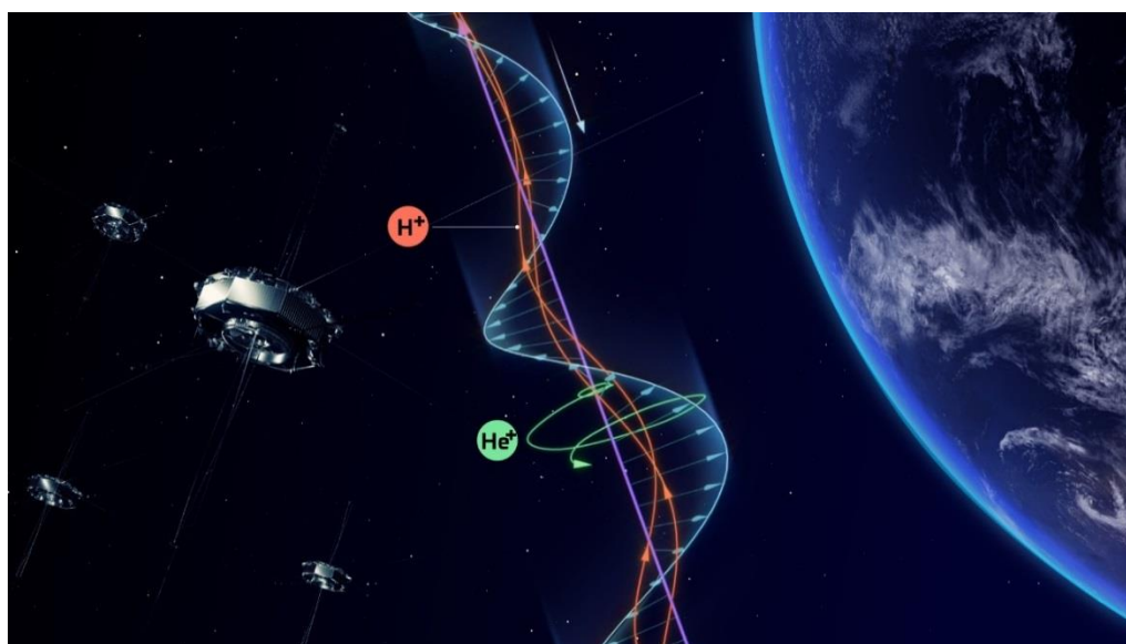
図1:波動粒子相互作用を観測する MMS 衛星のイメージ

米国 NASA の MMS 衛星編隊は、2015 年 9 月 1 日に高度約 6 万 km において、周期約 15 秒の電磁イオンサイクロロン波動と呼ばれるプラズマ波動を観測しました。また MMS 衛星編隊は、同時に、低エネルギーイオン計測装置 (FPI-DIS) によって、過去に例のない高い時間分解能でのイオンの観測に成功しました。FPI-DIS は JAXA、明星電気が開発に大きく貢献したもので、高い時間分解能で全方向から来たイオンを計測できるのが特徴です。これらのプラズマ波動とイオンのデータに対し、波動粒子相互作用直接解析の手法 (WPPIA) 注 4) を適用し、およそ 10~30 キロ電子ボルトのエネルギーを持った水素イオンの一部と 1 キロ電子ボルト程度のヘリウムイオンに特徴的な不均一 (ジャイロ非等方 注 5) ) が生じていることを検出しました。水素イオンのジャイロ非等方はサイクロロン共鳴条件 注 6) を満たす付近に集中しており、サイクロロン共鳴によってエネルギーを失いつつある粒子が多く、その失った分のエネルギーが波動に供給されていることを示すものでした。一方、ヘリウムイオンは極めてジャイロ非等方が大きく、ほぼ全てのヘリウムイオンが波動からエネルギーを得る特性のジャイロ非等方になっている瞬間についても確認できました。この大きなジャイロ非等方の特徴などによって、非共鳴加速と呼ばれるタイプの加速がヘリウムイオンに働いていることを初めて示しました。