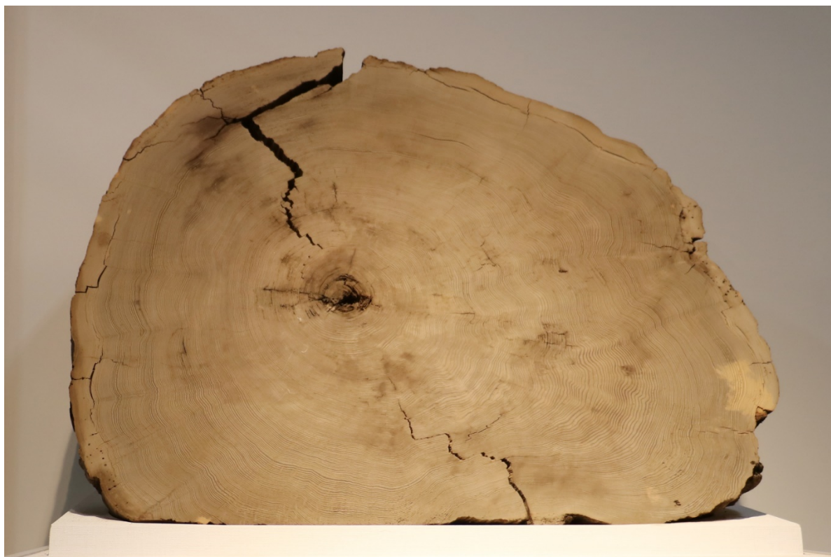
図 1：分析に用いたものと同じ個体の鳥海神代杉(山形大学附属博物館所蔵)。紀元前 466 年に噴火した鳥海山の山体崩壊により埋没した個体を入手した。1 年輪の幅は典型的に 3-5mm と比較的厚く、早材・晩材の剥離が可能となった。

宇宙線生成核種の測定分析から見つけている西暦 775 年、西暦 994 年、紀元前 660 年頃の 3 つの太陽面爆発が仮に現在発生すると、人工衛星の故障や通信障害など、現代社会へ甚大な被害が及ぶと考えられています。今回の研究は、そのような太陽面爆発が数年にわたって立て続けに発生した可能性を示すものです。今後、南極氷床コアのベリリウム 10 分析などから、紀元前 660 年頃のイベントについて、さらに詳しい情報がもたらされることが期待されます。